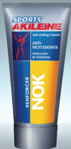
Ampoules et Irritations