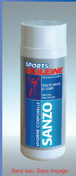
Sans eau. Sans rinçage.

Infos pratiques : www.asepta.com , www.medi-xtrem.com , www.editiongeoffroy.fr