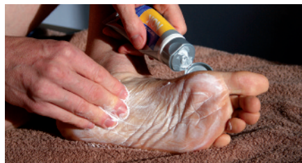
(Massage du pied avec la crème Nok)

Pour les randonnées de moyenne durée, ou si vous avez les pieds sensibles, l'objectif est de réduire les échauffements au niveau des points de frottements dans la chaussure. Pour cela, trois semaines avant la rando, à raison d'une fois par jour, appliquez la crème Nok Sports Akileïne* sur tout le pied en insistant bien sur les zones de contacts.