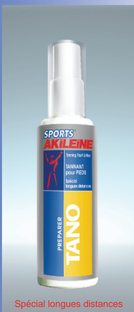
Spécial longues distances